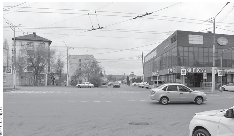
Сегодня на улице Лагерной есть кафе, магазины и жилые дома

События тех времен давно уж канули в Лету... Современная улица Лагерная — это территория плотной городской застройки индивидуального строительства с периодическим вкраплением в него различного рода мелких торговых точек. А о былых временах напоминает только ее название.